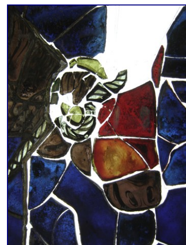
© CSM 2007 – éléments dissociés, travail de recomposition

C'est donc avec l'achèvement de cette deuxième phase de travaux, cinq grands vitraux réunis qui vont resplendir à nouveau, présentant la glorification de la Vierge Marie entourée d'archanges et de saints de l'Ancien et du Nouveau Testament.