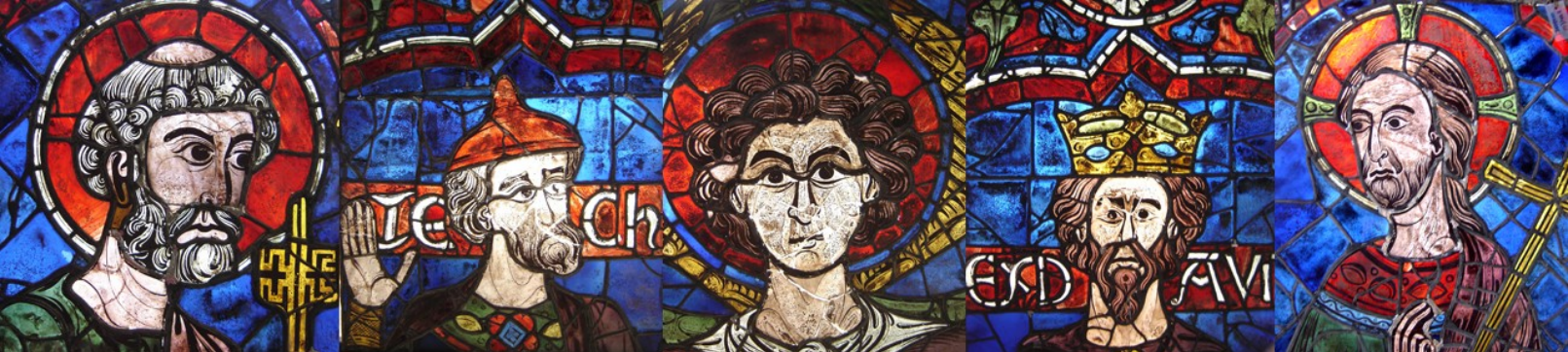
© CSM 2007 - Composition à partir de détails des vitraux de saint Pierre et de David et Ézéchiel, haut chœur, XIIIème siècle