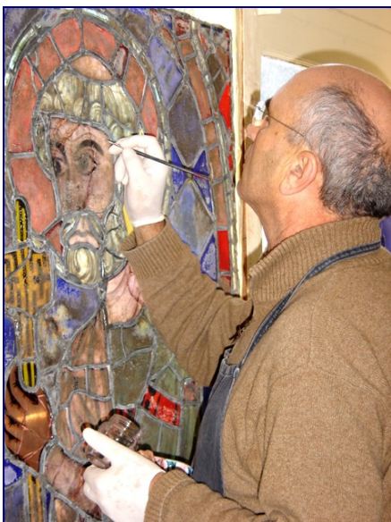
atelier Vitrail France, dernière retouche à la peinture, vitrail de Saint Pierre