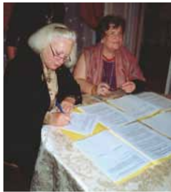
Signature de la Charte par les deux présidentes

Grâce à vous , l'association a déjà affecté 30 000 € à la future restauration de la baie 139. Un grand Merci! Continuons!