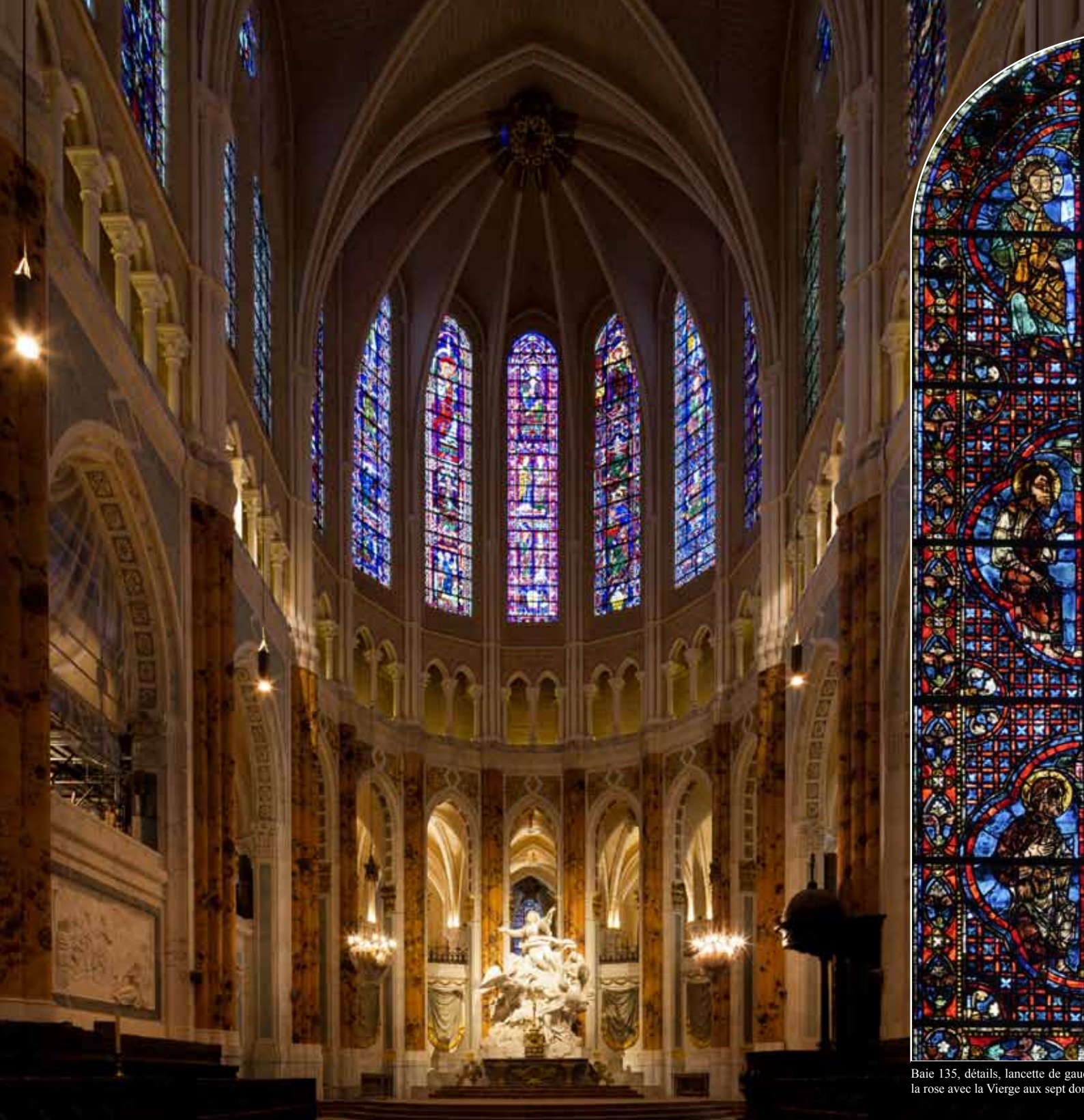
Baie 135, détails, lancette de gauche et rose avec la Vierge aux sept dons